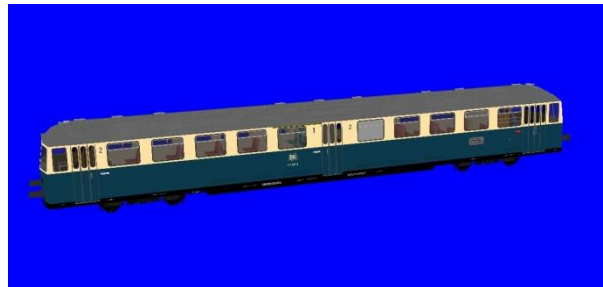
ETA 515 ozeanblau beige