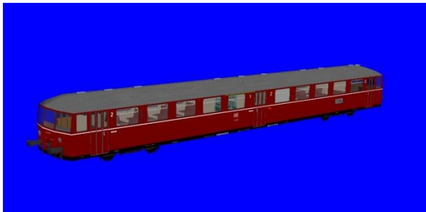
ESA 815 weinrot