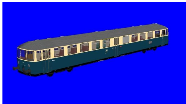
ESA 815 ozeanblau beige